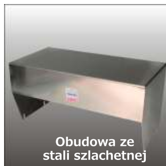
Obudowa ze stali szlachetnej