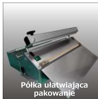
Półka ułatwiająca pakowanie