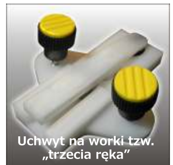
Uchwyt na worki tzw. „trzecia ręka”

Zmiany techniczne zastrzeżone. Szczegółowe dane techniczne znajdują państwo w instrukcji maszyny