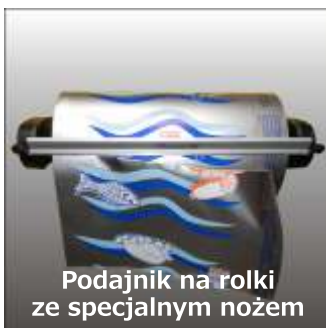
Podajnik na rolki ze specjalnym nożem

Urządzenie FS-Comfort znajduje zastosowanie nawet na małych stoiskach. Dzięki swoim niewielkim rozmiarom może bez przeszkód być wykorzystywane na ladach sprzedażowych w zasięgu wzroku kupujących.